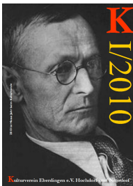
Hermann Hesse 2010