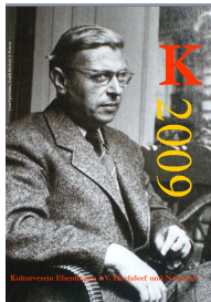
Jean-Paul Sartre 2009

Hildegard von Bingen, Jeanne D'Arc oder Madame Pompadour, Marlene Dietrich, Rosa Luxemburg, Berta Benz? Man blieb jedoch im Lande und nahm Katharina von Württemberg und Franziska von Hohenheim in die engste Auswahl. Eine Aufführung des Wortkinos Stuttgart, die eine Delegation des Kulturvereins sah, sprach jedoch eindeutig für Franziska von Hohenheim und die P-Frage für 2012 war entschieden.